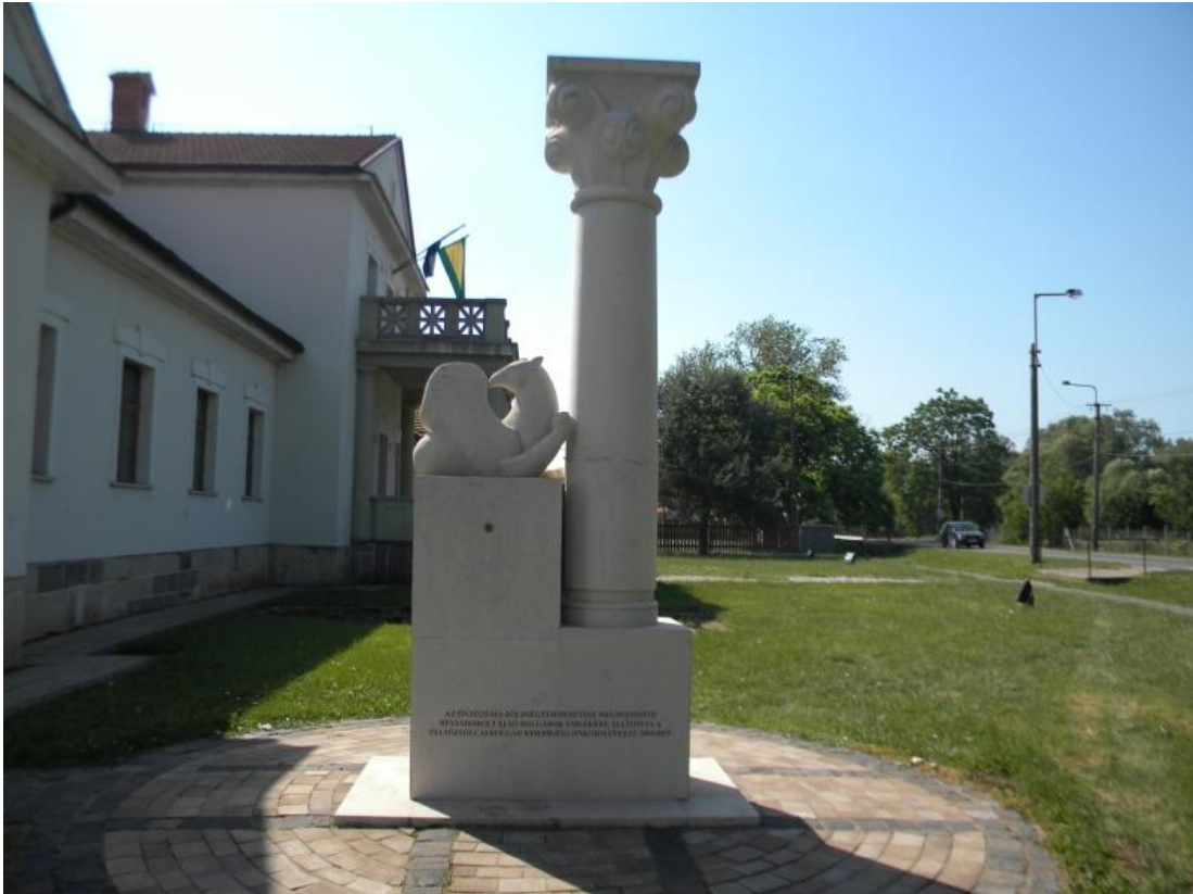
2004-ben, a bolgár kisebbség által állítatott szobor, a Bárczay-kastély előtt